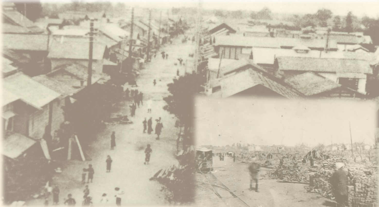
左：古川町全景(年代不明)

吉野作造記念館後期企画展「我が町おおさきの歴史・文化(第2回一学校篇)」で公開されます。